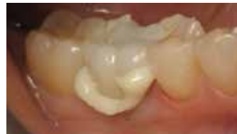
3. Einsetzen der Zirkonoxid-Krone. Leichte Überschussentfernung durch Anpolymerisieren.