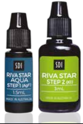
RIVA STAR AQUA FLASCHEN KIT Art.-Nr. 8800530