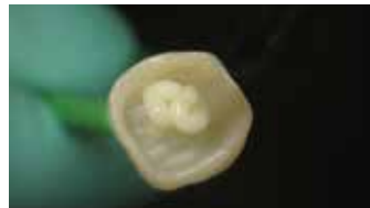
2. Riva Cem Automix mit idealer Konsistenz nach dem Ausbringen.