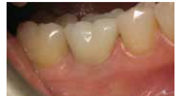
4. Fertige Restauration.