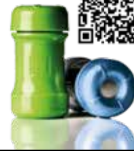
RIVA STAR AQUA KAPSELN Art.-Nr. 8800525